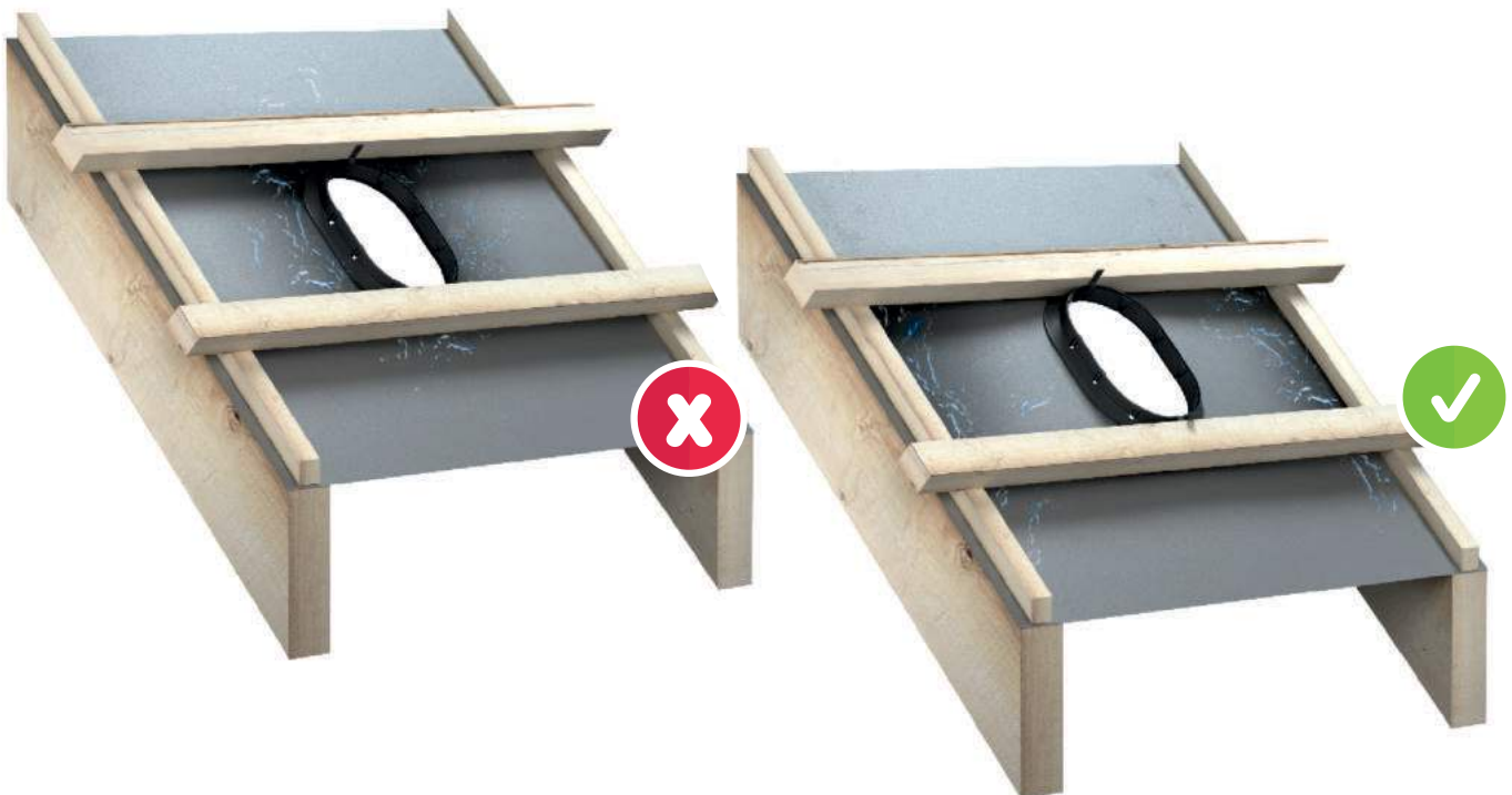
Apakšējais blīvējuma elements A